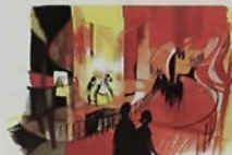
À l'intérieur de la boîte optique