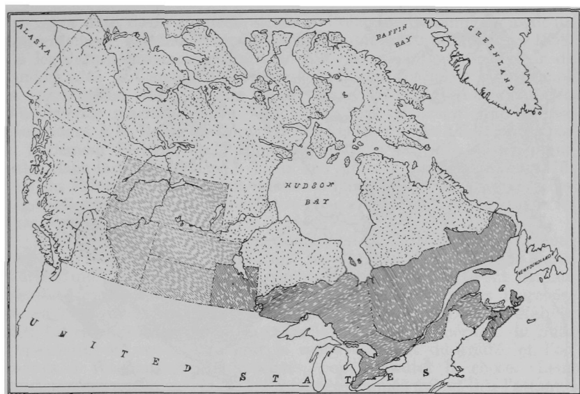
LE CANADA EN 1870, AVEC LA NOUVELLE PROVINCE DU MANITOBA, ET LES TERRITOIRES DU NORD-OUEST, TELS QU'ALORS ORGANISÉS.